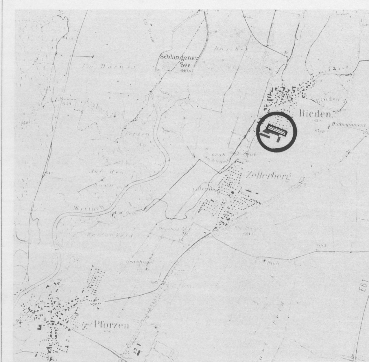
Übersichtslageplan M 1: 25.000

Kreisplanungsstelle des Landkreises Ostallgäu i.A. Abt (Abt)